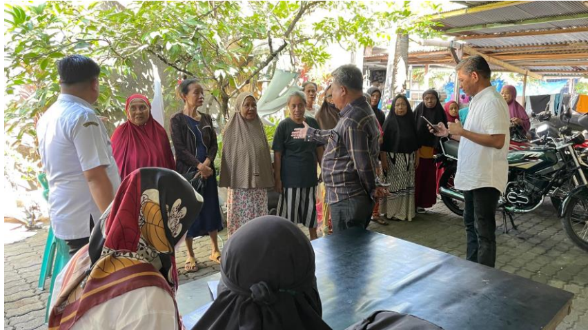
Foto Verifikasi dan Validasi Data Eks Kusta