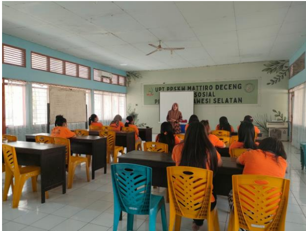
Foto Pelayanan Pemberian Pemenuhan Kebutuhan Dasar dalam Panti

Capaian indikator kinerja 2 pada sasaran 2 tahun 2024 sebesar 128.14% dengan kriteria sangat tinggi. Realisasi indikator kinerja 2 diperoleh berdasarkan jumlah Anak Terlantar, Lanjut Usia Terlantar, Wanita Tuna Susila yang terpenuhi kebutuhan dasarnya di dalam panti sebanyak 302 Orang serta Pemulangan Orang Terlantar sebanyak 199 Orang dan Bantuan Sosial Uang bagi eks kusta sebanyak 400 orang.